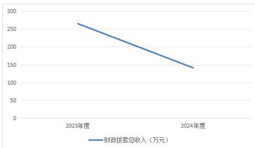
图 4：财政拨款收、支决算总计变动情况