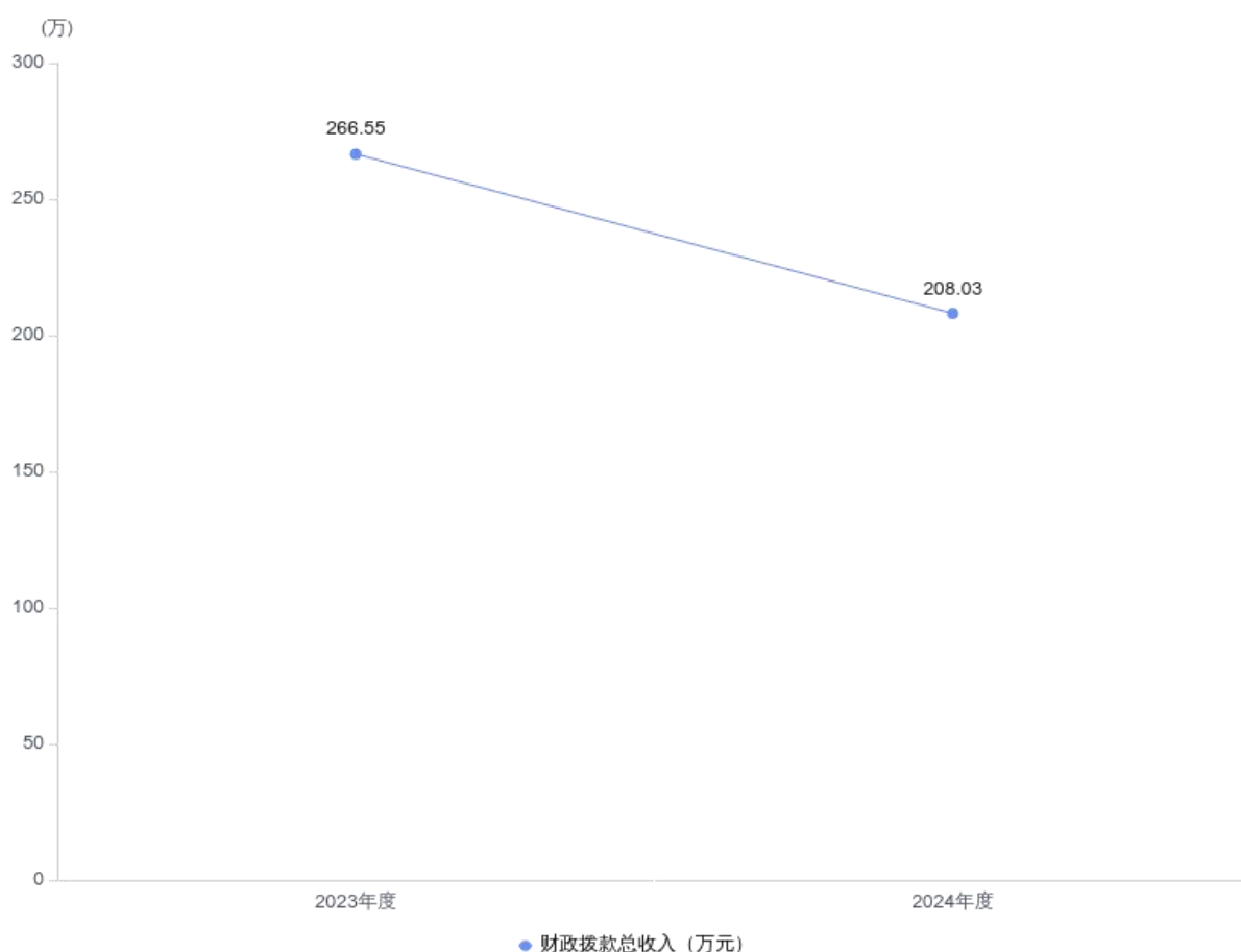
图 4：财政拨款收、支决算总计变动情况

2024 年度财政拨款收入中，一般公共预算财政拨款收入 208.03 万元，比 2023 年度决算数减少 58.52 万元。减少主要原因是 2024 年度 1 名在职人员转退休，2 名无计划无编制人员调出，人员经费减少。政府性基金预算财政拨款收入 0 万元，比 2023 年度决算数无增减。国有资本经营预算财政拨款收入 0 万元，比 2023 年度决算数无增减。