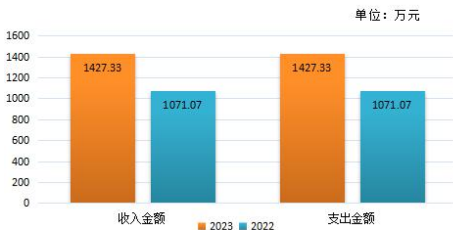
收、支决算总计变动情况

2023年度收、支总计1,427.33万元。与 2022年度相比，收、支总计各增加356.26万元，增长33.26%，主要原因是新招录3人追加经费，职工正常增资，增加项目经费等。