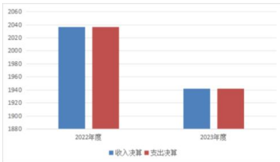
图 4：财政拨款收、支决算总计变动情况

2023 年度财政拨款收入中，一般公共预算财政拨款收入 1941.8 万元，比 2022 年度决算数减少 95.14 万元。减少主要原因是项目经费减少 131.1 万，基本支出增加 226.24 万。