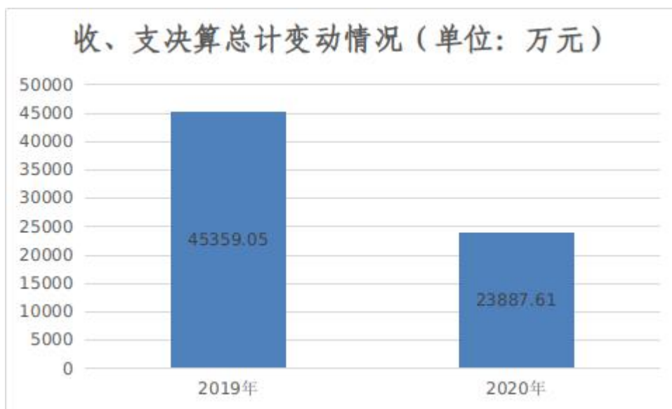
图 1：收、支决算总计变动情况（单位：万元）

2020 年度收、支总计 23887.61 万元。与 2019 年度相比，收、支总计各减少 21471.44 万元，下降 47.0%，主要原因是：突发公共卫生事件应急处理科目，支出工人村康复驿站经费及其他防疫经费 1256.69 万元，发生老旧小区改造经费 9235.71 万元，物业企业疫情防控补助资金 651.42 万元，青宜居保障房小区立面整治经费 379.30 万元，红色引擎工程经费 403.32 万元，保障房租金补贴、租赁补贴等 1743.68 万元，上年 3.48 亿保障房安居工程专项资金，用于购买公租房。