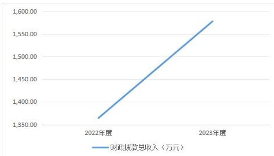
图 4: 财政拨款收、支决算总计变动情况

2023 年度财政拨款收入中,一般公共预算财政拨款收入 1,578.1 万元,比 2022 年度决算数增加 213.56 万元。主要原因是本年度在职退休待遇预发比上年增加。