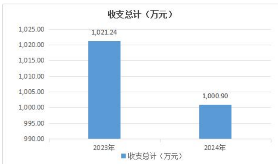
图 1：收、支决算总计变动情况

2024 年度收、支总计 1,000.9 万元。与 2023 年度相比，收、支总计各减少 20.34 万元，下降 2%，主要原因是本年度其他收入收、支决算减少。