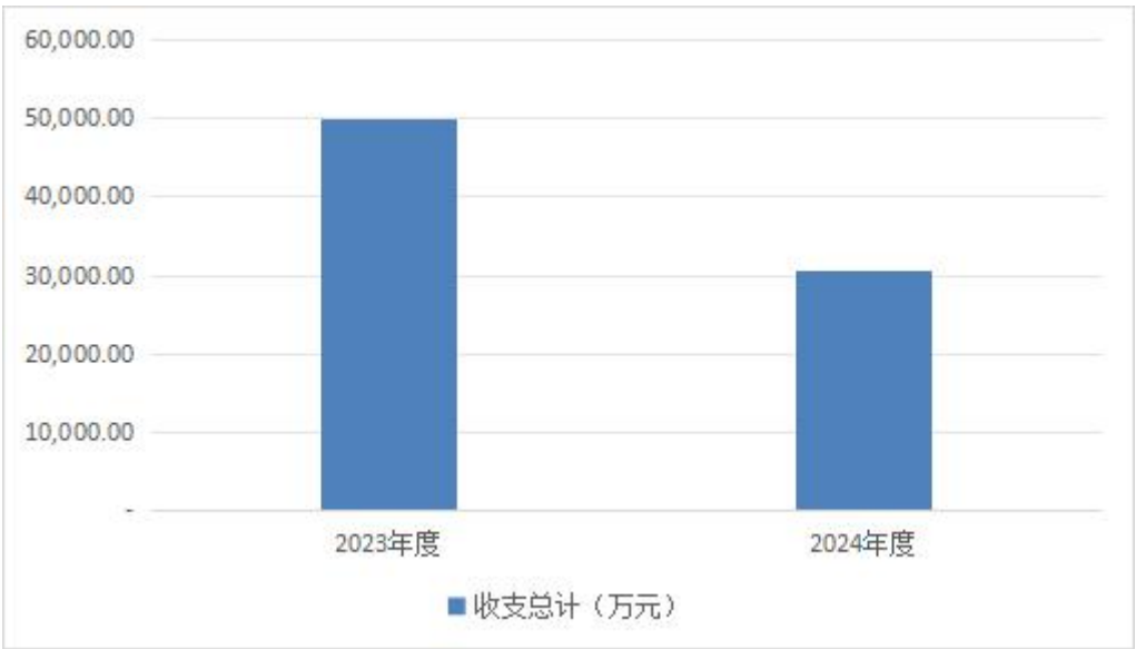
图 1：收、支决算总计变动情况

2024 年度收、支总计 30,574.31 万元。与 2023 年度相比，收、支总计各减少 19,329.31 万元，减少 38.7%，主要原因是：一是 2024 年无平战结合大楼建设项目经费，导致财政拨款减少；二是医院下设红卫路社区卫生服务中心实行独立核算导致收入减少。