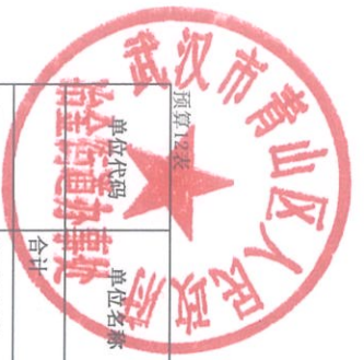
政府向社会力量购买服务预算表